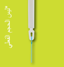
تأمين الحجم القلبي

لولب بلاستيكي صغير ومرن على شكل حرف T يوضع داخل رحمك. بمجرد تثبيته، لن تشعرى حتى أنه موجود.